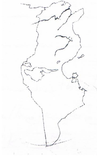
جدول إسناد الأعداد