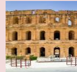
Amphithéâtre d'El Jem